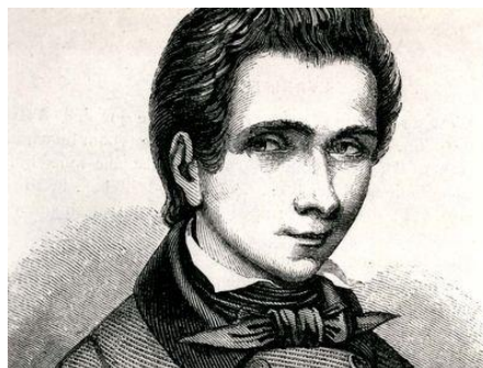
Galois 1811- 1832